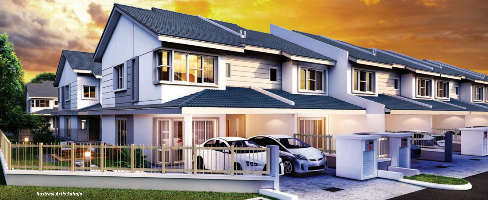
Ilustrasi Artis Sahaja