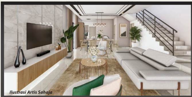
Ilustrasi Artis Sahaja